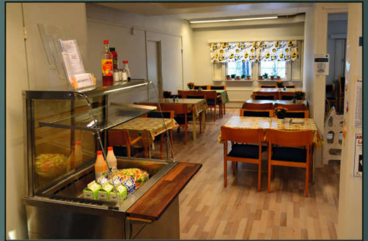
Artturintuvan ruokasali. Tilat on myös vuokrattavissa.

Tiloja on myös mahdollista vuokrata erilaisiin tilaisuuksiin, jotka ovat tarkoitettu vain tietyille ryhmille, esimerkiksi taloyhtiön kokouksiin. Voit tilata meiltä AV-laitteet, kahvit ja kahvileivät etukäteen tilaisuuttasi varten pientä korvausta vastaan.