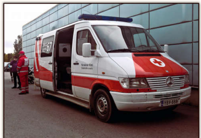
Ouluntullin SPR:n ambulanssi tuvan pihalla

Avajaisissa pidettiin myös arpajaiset. Voittajat julkistettiin seuraavalla viikolla, ja palkinnoksi he saivat muunmuassa lounaslippuja Artturintuvan lounaskahvilaan, lahjakortin ompelupalvelupistelle, S-ryhmän 10€ lahjakortin ja kahvipaketin. Tuvan väki onnittelee voittajia.